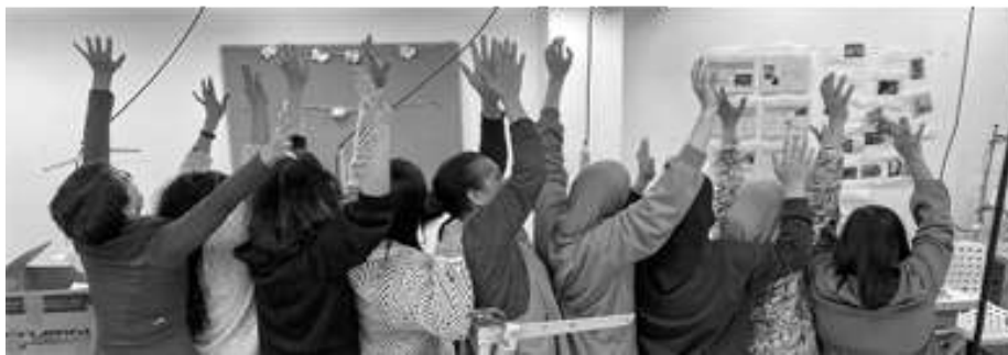
Participantes del taller de Ellas lo Bordan.