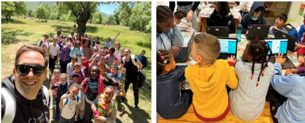
Asistentes de las actividades de la Fundación Balia.