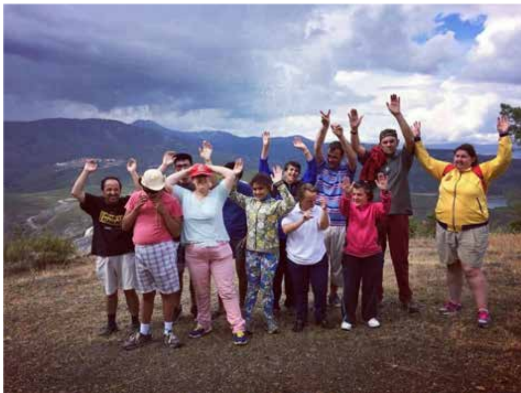
Asistentes de las actividades de la Fundación Proyecto Persona.