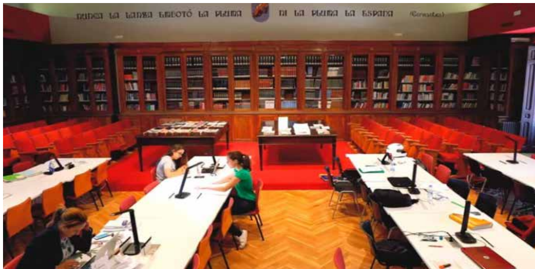
Biblioteca de la Facultad de Ciencias Sociales. Universidad de Nebrija.

Cantidad aportada: Las becas se convocan por un importe bruto equivalente al 80 % de los honorarios de docencia, excluidos la reserva de plaza y matrícula, del primer curso del Grado en Finanzas y Seguros.