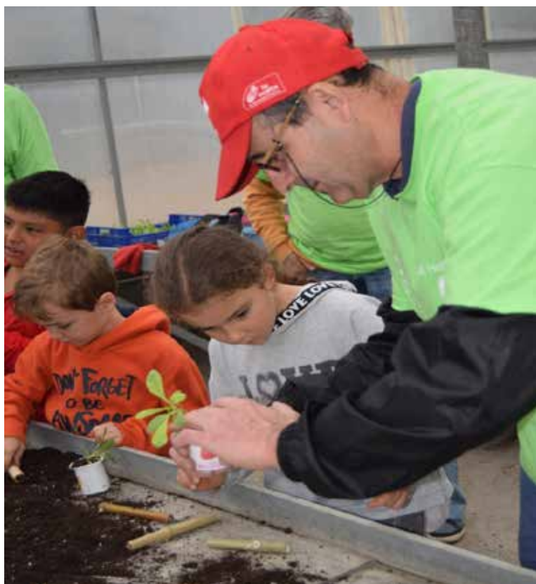
Participantes del programa Naturalezas Diversas de la Fundación Gil Gayarre.

Cantidad aportada por nuestra Fundación : 9.700 euros.