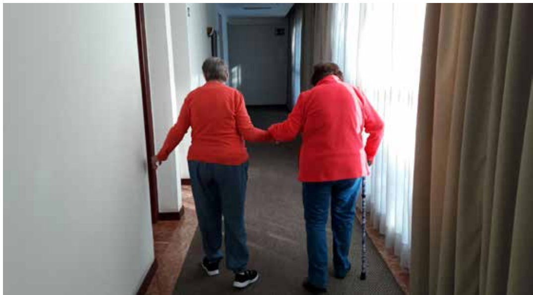
Personas atendidas por FUTUMAD.

Beneficiarios: 35 personas con discapacidad Intelectual.