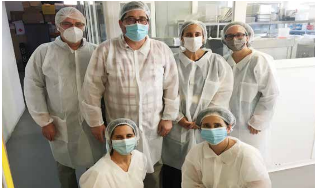
Miembros de la Fundación Carlos Sunyer durante la visita a Carifood.