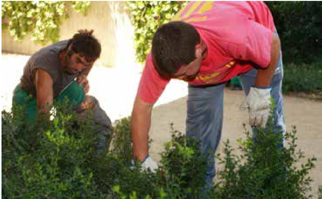
Participantes del programa Naturalezas Diversas de la Fundación Gil Gayarre.