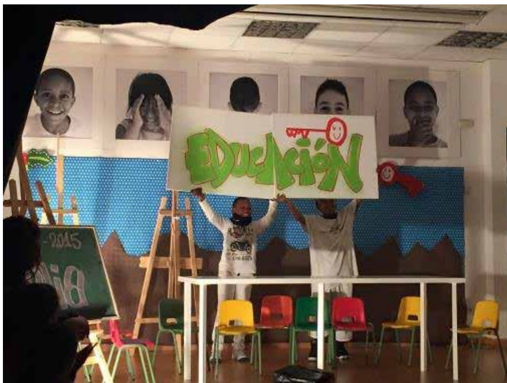
Asistentes de las actividades de la Fundación Balía.